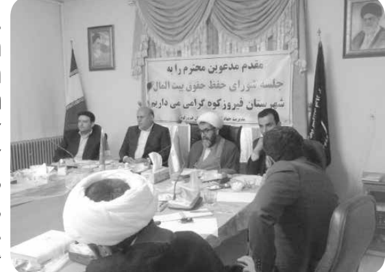
روابط عمومی سازمان جهاد کشاورزی استان تهران - از سوی شورای حفظ حقوق بیت المال استان تهران

شهرستان فیروز کوه به عنوان پایلوت حفظ کاربری اراضی کشاورزی و مقابله با زمین خواری در سطح استان تهران معرفی شد. اولین جلسه شورای حفظ حقوق بیت المال با حضور کلیه اعضا در محل سالن جلسات مدیریت جهاد کشاورزی شهرستان فیروز کوه تشکیل شد. در این جلسه بعد از ارائه توضیحات لازم توسط رئیس دادگستری، امام جمعه، دادستان و فرماندار شهرستان، ایلکا مدیر جهاد کشاورزی فیروز کوه گزارشی از اقدامات انجام شده در سال ۹۵ را ارائه کرد. وی با مهم خواندن حفظ کاربری اراضی کشاورزی از زون بندی شهرستان و انتخاب عوامل ده گردشی برای